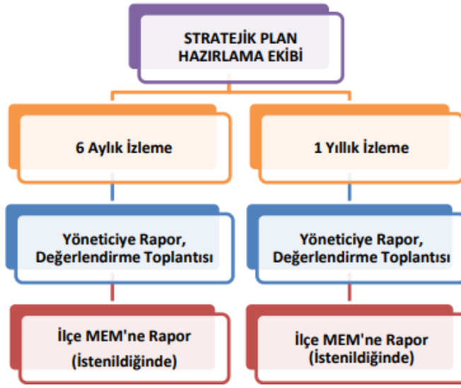
Tablo 33: 2024-2025 Eğitim Öğretim Yılı Stratejik Plan İzleme ve Değerlendirme Tablosu

Stratejik planın izlenmesinde 6 aylık dönemlerde izleme yapılacak denetim birimleri, il ve ilçe millî eğitim müdürlüğü ve Bakanlık denetim ve kontrollerine hazır halde tutulacaktır. Yıllık planın uygulanmasında yürütme ekipleri ve eylem sorumlularıyla aylık ilerleme toplantıları yapılacaktır. Toplantıda bir önceki ayda yapılanlar ve bir sonraki ayda yapılacaklar görüşülüp karara bağlanacaktır.