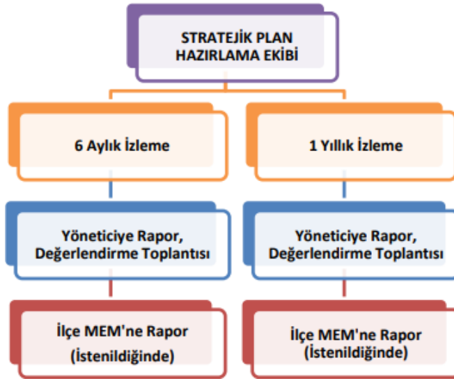
Tablo 33: 2024-2025 Eğitim Öğretim Yılı Stratejik Plan İzleme ve Değerlendirme Tablosu

Stratejik planın izlenmesinde 6 aylık dönemlerde izleme yapılacak denetim birimleri, il ve ilçe millî eğitim müdürlüğü ve Bakanlık denetim ve kontrollerine hazır halde tutulacaktır. Yıllık planın uygulanmasında yürütme ekipleri ve eylem sorumlularıyla aylık ilerleme toplantıları yapılacaktır. Toplantıda bir önceki ayda yapılanlar ve bir sonraki ayda yapılacaklar görüşülüp karara bağlanacaktır.